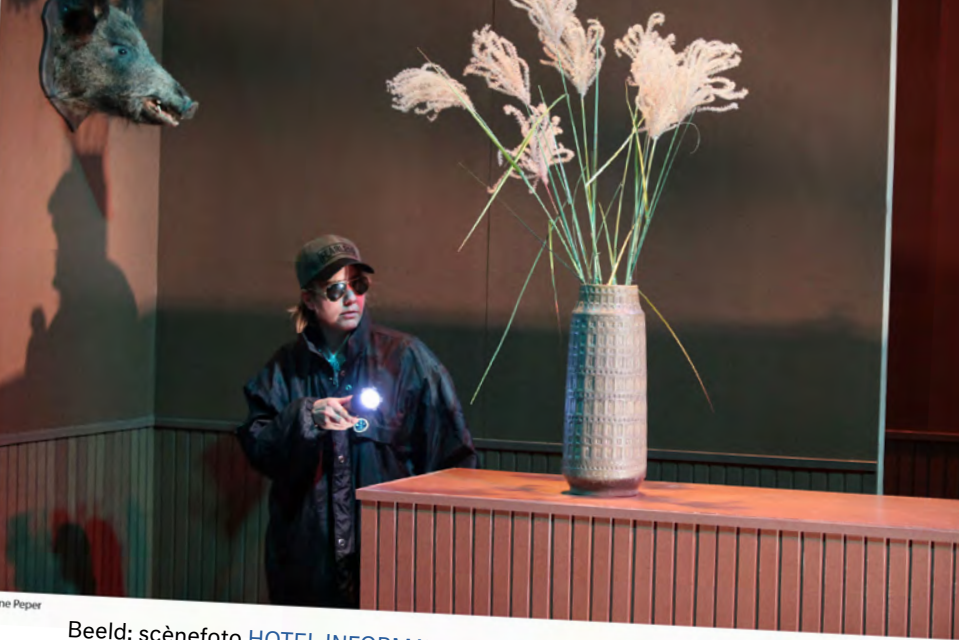
Beeld: scènefoto HOTEL INFORMATIE