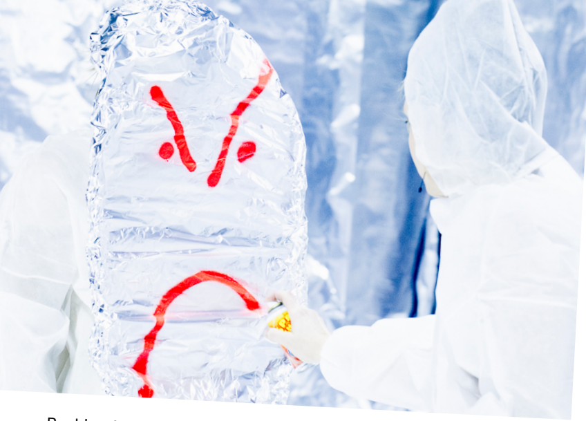
Beeld: scènefoto TUSSENTIJD