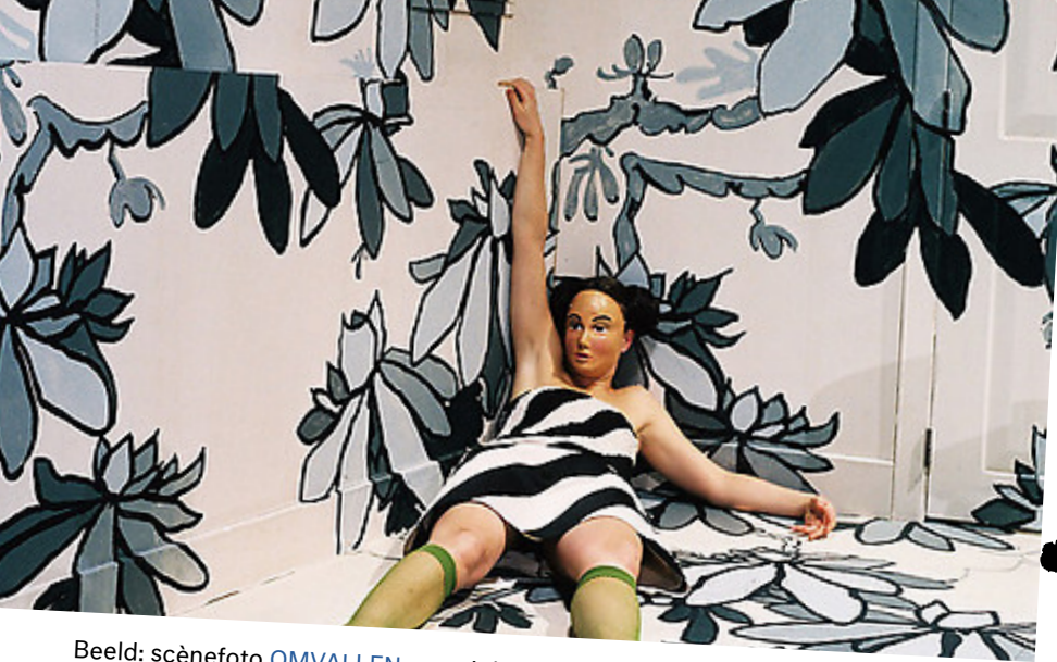
Beeld: scènefoto OMVALLEN

Regie: Bram Coopmans Tekst: Magne van den Berg Spel: Anna Schoen, Lotte Dunselman e.a. Muziek: Mauro Casarini