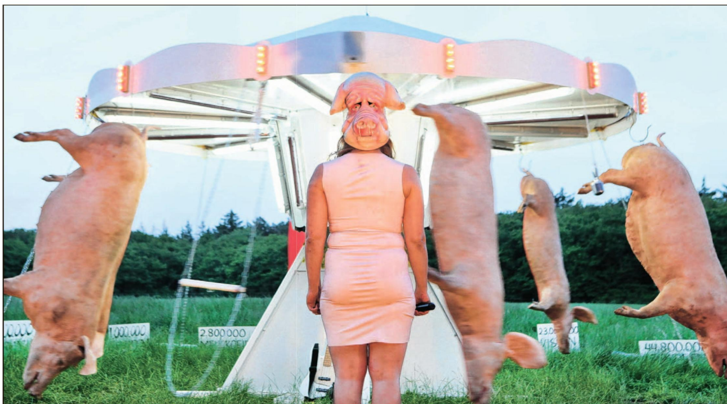
■ Een opgepimpte zweefmolen, geschilderd in steriel slachthuis-wit, speelt een belangrijke rol in stel je bent een koe , de nieuwe voorstelling van het Arnhemse gezelschap tgECHO.